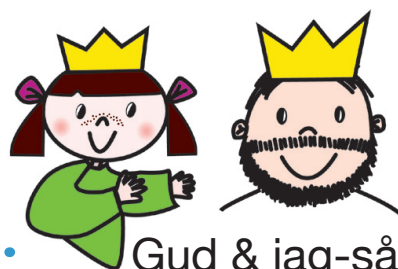
Gud & jag-sång